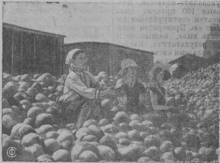
Сортировка и погрузка арбузов на станции Павлодар-Омской железной дороги.

Небывалый урожай арбузов получен в 1937 году на бахчах колхозов Павлодарского района