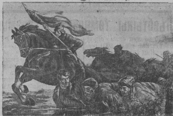
Снимок вылын: „Советскэй родина понда“ картина И. М. Тоидзе художниклэн.

Москвын осис художественной выставка „РККА-лэ да Военно-морскэй флотлэ 20 год“. Выставка вылэ представитэмэсь 450 мымда живописись произведенийэс, скульптураез да советскэй искусствосись виднейшей мастеррезлэн графиккез: