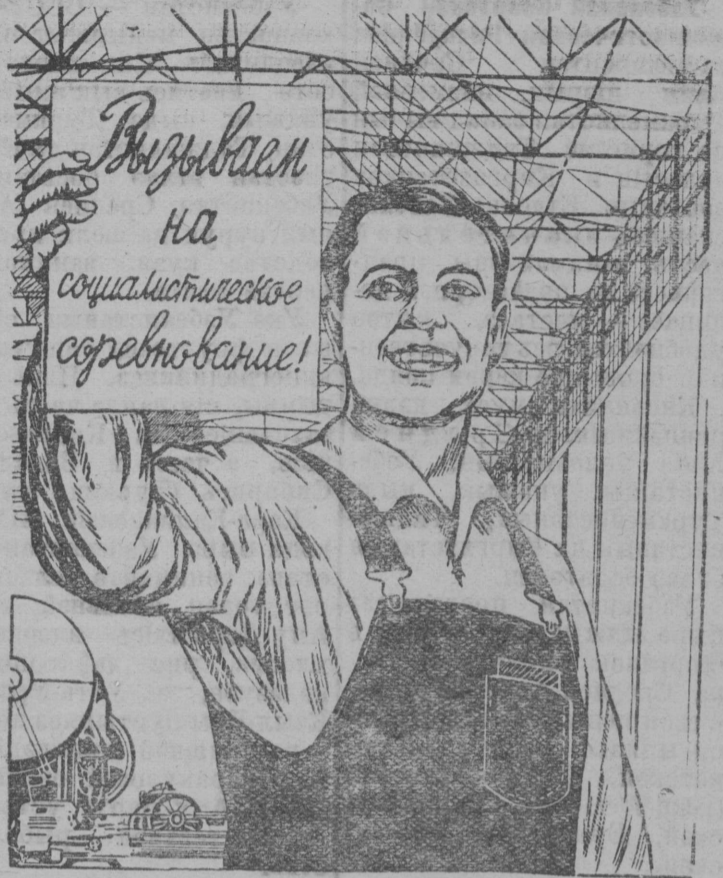
ВСТРЕТИМ ВЫБОРЫ В ВЕРХОВНЫЙ СОВЕТ РСФСР НОВЫМ ПОДЪЕМОМ СОЦИАЛИСТИЧЕСКОГО СОРЕВНОВАНИЯ НОВЫМИ ПРОИЗВОДСТВЕННЫМИ ПОБЕДАМИ!

Избирательнэй участоккезисэ председателлэезэ и секретарезэс асланыс основнэй удж вылісэ езе освободитэ. Выборрез чулэтэм понда энэдз ешэ мукэд участоккезын помещеннэезь абузэсь, а кызд кытэн и емэсь, то оборудуйтэмэсь. Гэрд материал, кэдэ л'едээм избирательнэй участоккез понда, Косинскэй райпотребсоюз видзис мэдик целлэез.