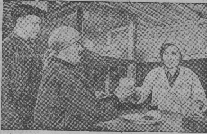
Снимок вылын: Киров нима апатитовой рудникса подземной буфетын.

1939 гося декабрь 31 лунö тыри 10 во СССР-са апатитовой промышленностьлөн центр—Кировск кар оснуйтöмлы.