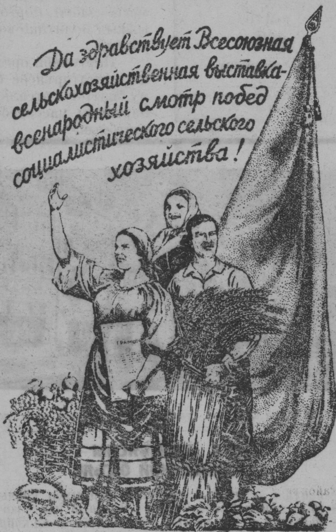
Выставкывса участниктыяс—мирөвий рекордментыяс

Да здравствует Всесоюзная сельскохозяйственная выставка- всенародный смотр побед социалистического сельского хозяйства!