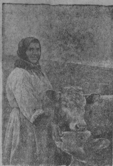
А. Г. Пластун аслае питомецьяскөд—кык төлысся бычок „Отбойкөд“, коллөн среднесуточной привесыс 1600 грамм да 4 төлысся телка „Снежинкакөд“, коллөн среднесуточной привесыс 1200 грамм.