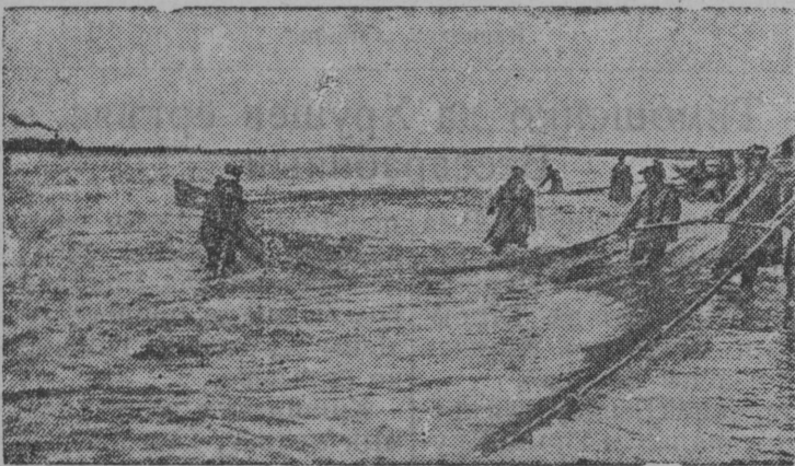
Колхозникясыс кысбөны тыв.

„Красный труженик“ колхоз сайо (Усть-Большерецкой район, Камчатской область) закрепитма Озёрной юлысь басейн. 1939-өд вося чери кыян план колхоз тыртсө 130 процент выло.