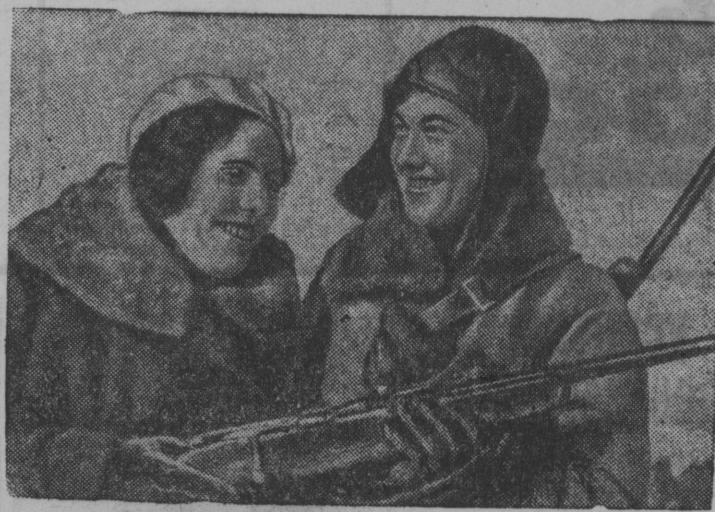
Энгельсима колхозын (Куйбышевской область) бура пуктөма оборонной удж.