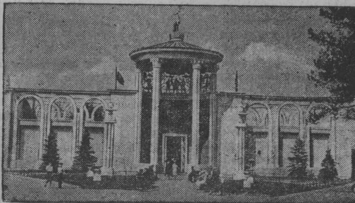
ВСХВ вылын „Охота да звероводство“ павильон.

Английской газета „Дей- ли телеграф“ энд морнинг пост“ гижө немецъясөн выль государство—Флан- дрия создайтөм йылысь. Сийө включитас некимын бельгийской провинцияе, Голландиялысь да Север- ной Франциялысь юкбнъ- яе.