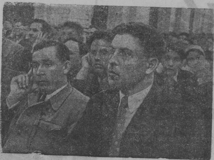
СССР-са Верховной Советлөн VII Сессия. Заседаниеяс залын воддза план вылын—депутат А. Г. Стаханов.