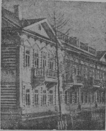
Северной Морской туйлөн Главной Управлениеса пилотьяслён керка заполярной кар Игаркаын (Красноярской край).

Кымын унджык лоасны животноводческой фермаяс, кымын унджык лоас колхозьясын скот, сымын унджык лоб мян странаын яй, вий, йёв, кучкьяс, сымын вынйбразжык да озырджык лоас советской государство.