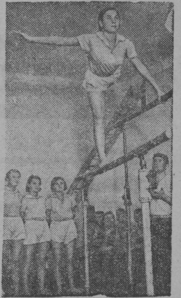
Киров нима школаён спортивной залын гимнастической кружокён занятияеяс (Караганда кар).

Албанияса фронтьяс вылын итальянецьяс вёчисны уна контратакаяс, но регид вёлыны вынужденёсь бёрыньчыны бёр сийё позициясь, кытысь петалины. Греческой войска мунисны албанской побережье кузя. Фронтлён войыв участвокас, джуджыд лым да чорыд стужаяс вылё видёдтёг, мунёны бойяс.