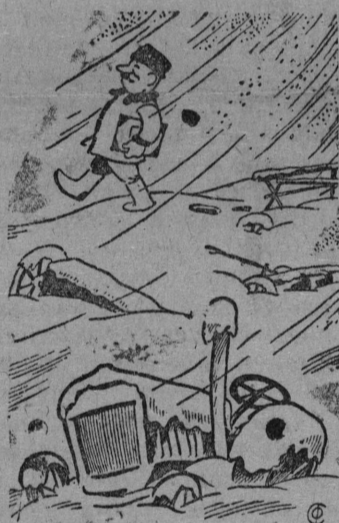
Вихри враждебные веют над нами...

На Белолевском и Огезском участках сноповязалки, молотилки, тракторные саялки и другие сложнейшие сель.-хоз. машины до сих пор стоят под открытым небом.