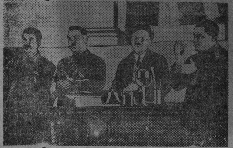
НА СНИМКЕ: открытие съезда. Выборы президиума (орация тов. Сталину.)