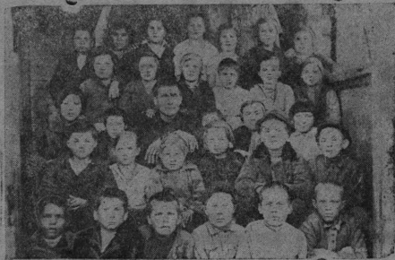
Udarnikkeez velətiьšez Arxangelskəj skolais