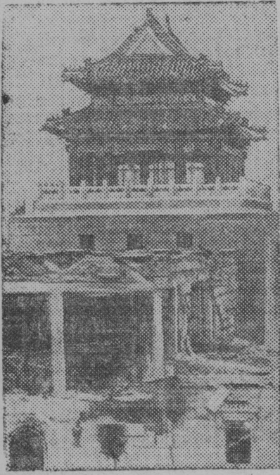
Вид китайского музея после бомбардировки

Японская авиация разрушает исторические памятники Китая.