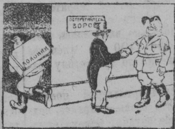
«Работа» на пару...