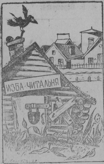
Тач выглядят — избы читальни в Чазевском сельсовете и У-Кокколе