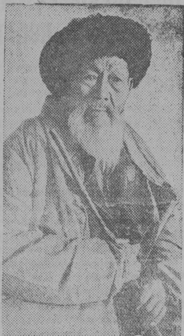
Народный певец Казахстана Джамбул.

3 декабря Джамбул будет осматривать метрополитен им. Л. М. Кагановича и совершит на автомашине прогулку по Москве.