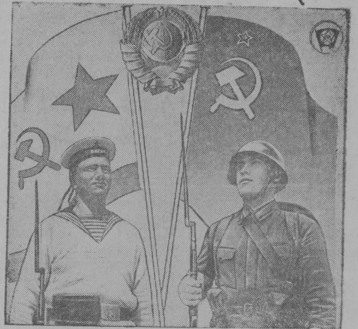
На снимке: Из альбома «XX-лет Всесоюзного Ленинского Комсомола», выпущенного фотоиздатом Союзфото. Фотоомонтаж художника Корецкого.