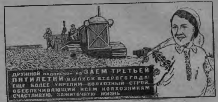
Плакат, кудйз лэзэмын „Искусство“ издательствоен.