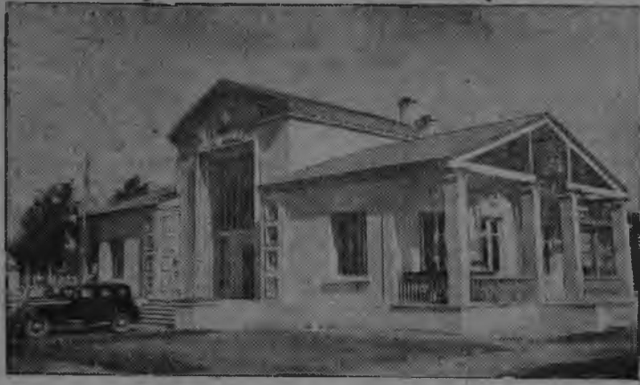
Сурел вылын: „Гурт'ёсын выльёсы“, выставка разделысь Павильон „Колхозной клуб“.