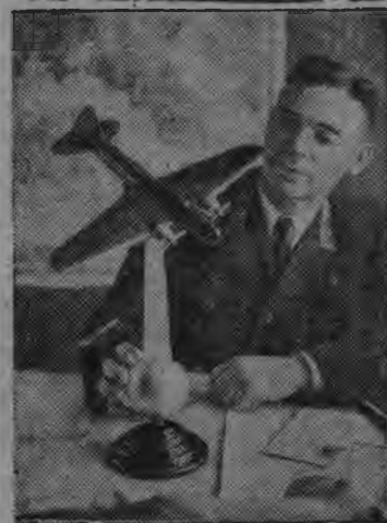
Суред вылын: (бурысен палляне) „Москва“ самолетлэн командирез Советской Союзлэн Героиз В. К. Коккинаки аслаз квартирайз Менжинскийлэн нимыныз заводлэн коллективезлэсь „Москва“ самолетлэсь подарить карем макетэс учке, но „Москва“ самолетлэн штурманэз, майор М. К. Гордиенко.