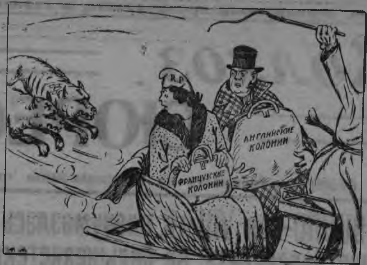
—Асьмелэн единственной спасенимы, мадам.—гилесытд соослы чемо-ландэс куштыны.