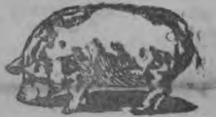
Мог ныр парсь.

Туж зэк кудыин басытчим вормын. Со гырисьин «английскэй норкшпирскэй парсьес» дымимы би дункейин кутекыном. Аслам мурт'ес «мог ныр парсь» со парсьесы шуо. Со «мог ныр парсьес», сармыс жалка вораны узо. Аслам палан сое «кузь ныр парсьес» туж сураськемын на.