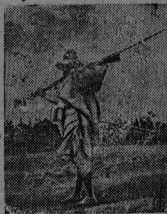
НА СНИМКЕ: Абиссинский солдат нерегулярной части.