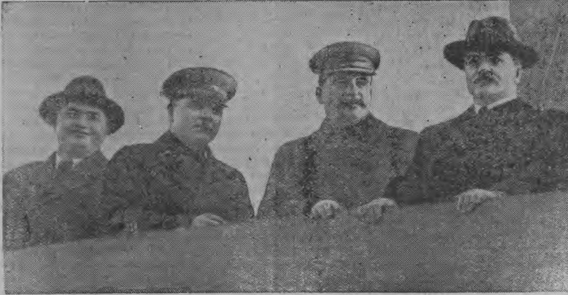
Бурьсен палляне: В. М. Молотов, И. В. Сталин, К. Е. Ворошилов но Г. М. Димитров эш'ёс мовзолейлэн трибунаыз.