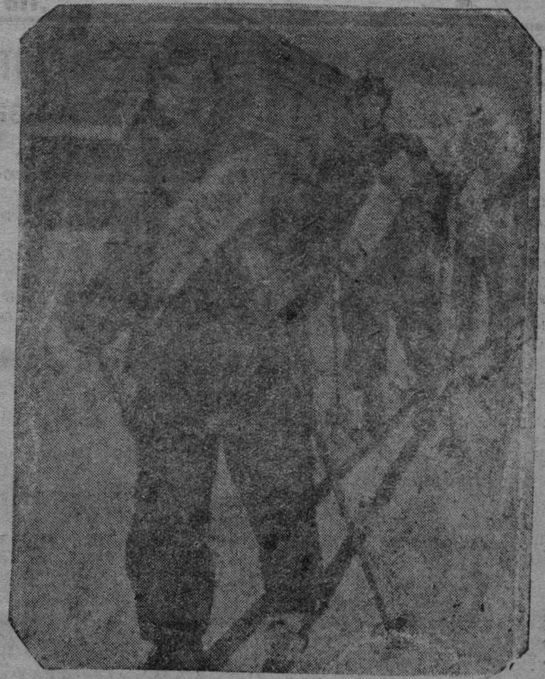
Участники лыжного пробега Кудымкар—В-Лупья—Кудымкар