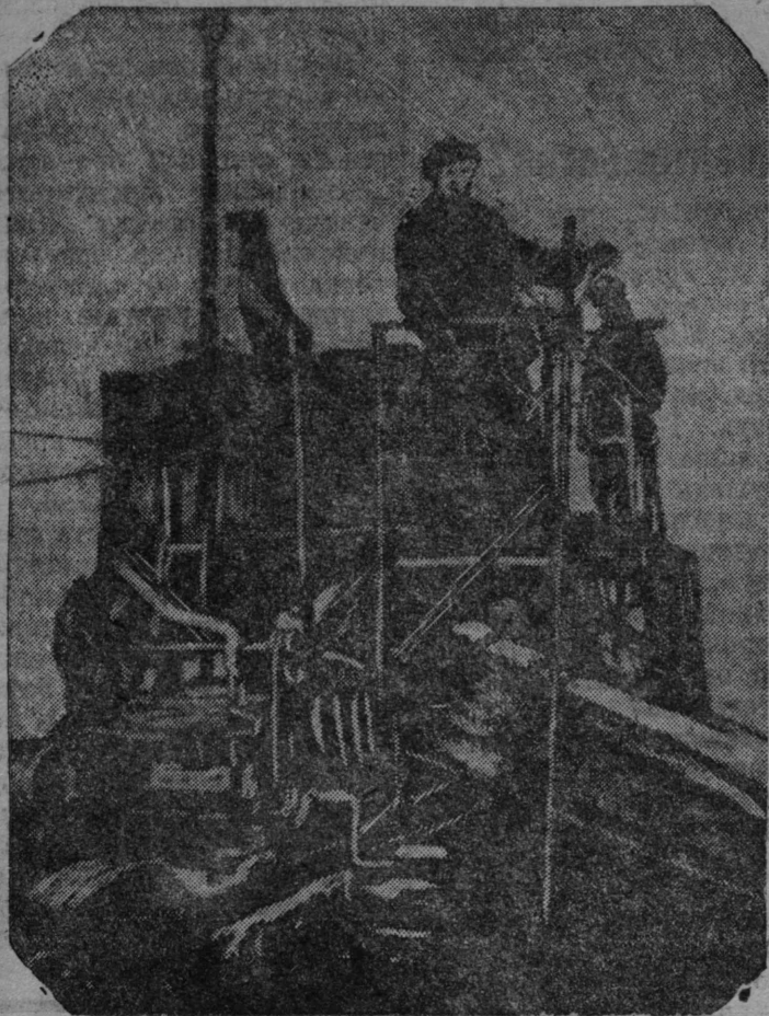
Комбайн Кудымкарской МТС на полях Питеевского колхоза (1935 год).