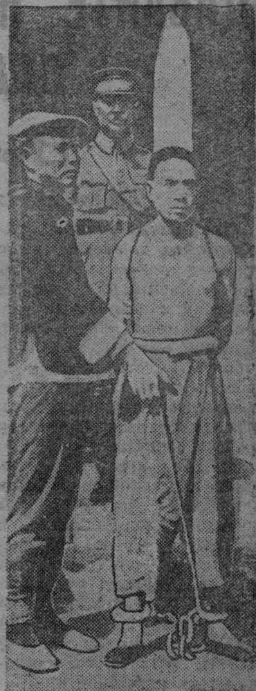
НА СНИМКЕ: Уличная сцена в Китае, приговоренного к смерти красного партизана проводят по улицам города, скованного и с доской за спиной, на которой перечислены „преступления“ (Из Швейцарского журнала Швейцер Иллюстрате)