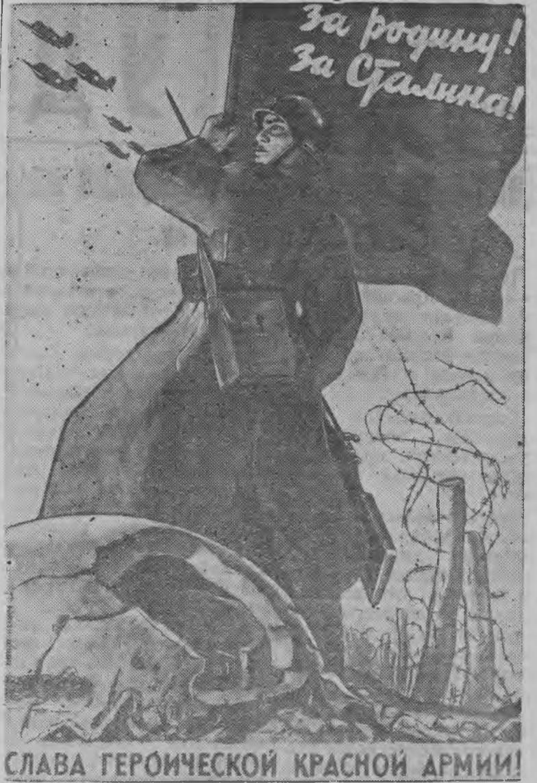
СЛАВА ГЕРОИЧЕСКОЙ КРАСНОЙ АРМИИ!

Котькуд нуналэн будэ но юнма Красной Армии лэн боевой могуществоез. Со быгатоз ж о г но ожит вир кыстыса котькыче противникез вормыны.