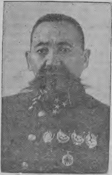
Генерал-полковник О. И. Гороодовиков.

Завод'ёсысь, колхоз'ёсысь, школаосысь лыктысь боец'ёс-красноармеец'ёс ролналы преданностенызы чош сьобразы ваё боевой задор, тодонлык'ёслы кулэ-яськон. Соос жог овладевать каро военной тодонлык'ёсын но л у о перво-