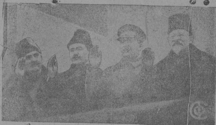
Парад Красной армии в честь XVII съезда партии 9 февраля в Москве на Красной площади состоялся большой парад частей Красной армии в честь XVII съезда партии. На снимке:—т. т. Сталин, Молотов, Каганович и Калинин на трибуне приветствуют войска.