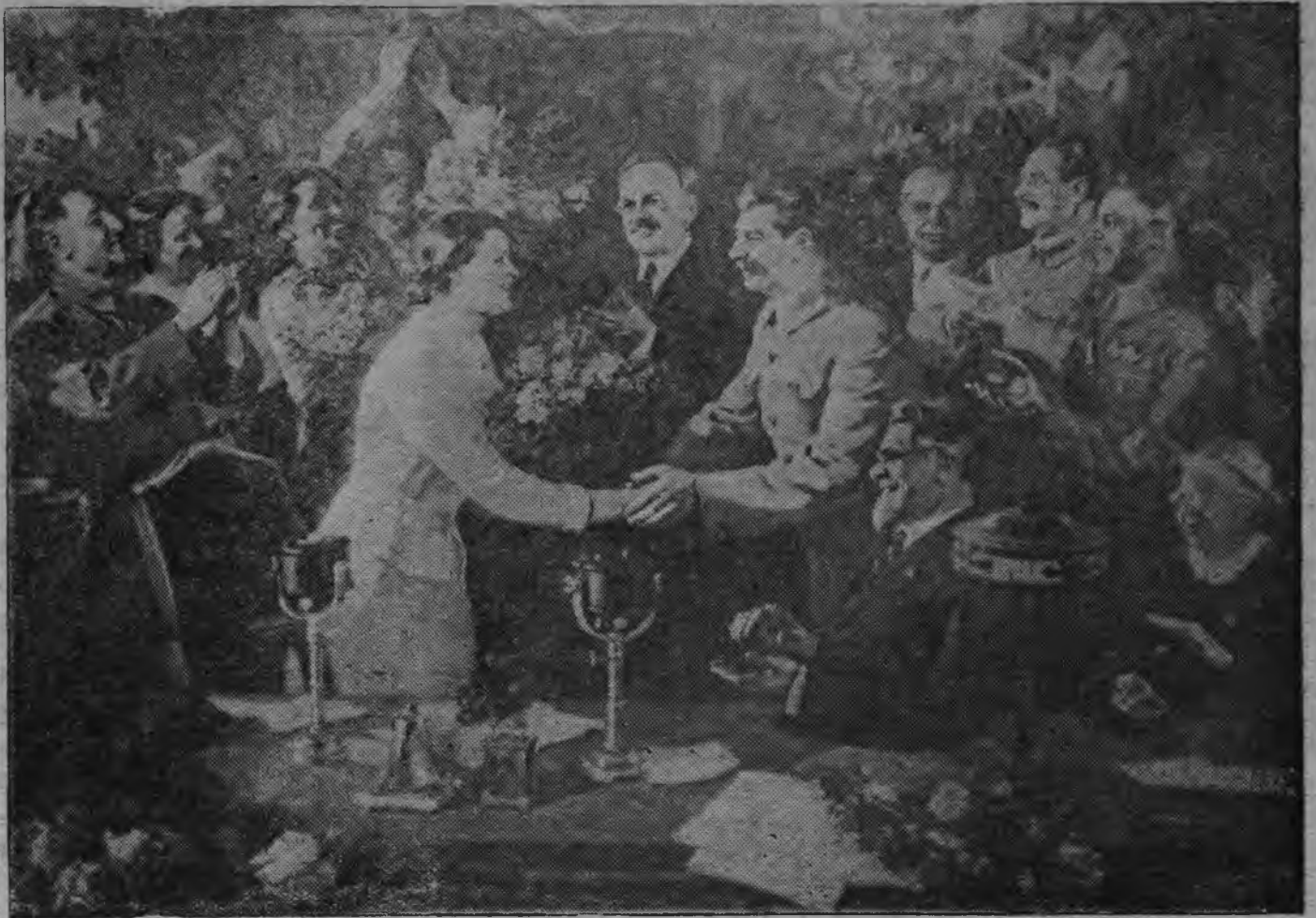
Партилен но правительстволэн кивалтысьёсыз тяжелой промышленностьлэн общественницаосызлэн совещанизылэн Президиумаз, Кремльын. (Суредзэ В. П. Ефанов художниклэи).

— Табере мон пипал луи, пид'ёсы мынам катчигеэ ветлыны кутскизы.