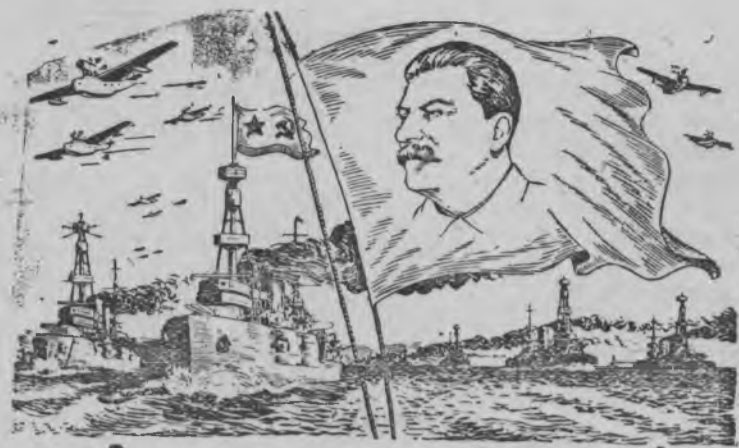
Дано мед луоз Советской Союзлэн Военно-Морской Флотэз—советской морской границаосты оскымон возьмась!

Итальянской политической круг'ёс верало, что та событиослэн ортчон районызы Италиэн интерес'ёсыз öвöл. 23 июле. (ТАСС).