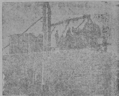
Серпас ылын: Көрткерөс „1 май“-са колхозчыкяс сілөсүтчөны

Візін, Гемецькік сікт „Максім Горкөй“ колхозо сүлсөмәкө кәтөм јөз дә пәдмөдөһи вәзә вьлө гөд дә шөркөдә олысјасөс пырөһи колхозо. Петкөдләм сүлсөһијасөс: