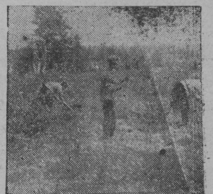
Вігін ју дорын ыщкөны