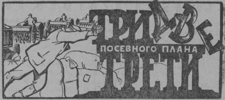
Ковасны көза план содтөдөн тыртөм вөсна.