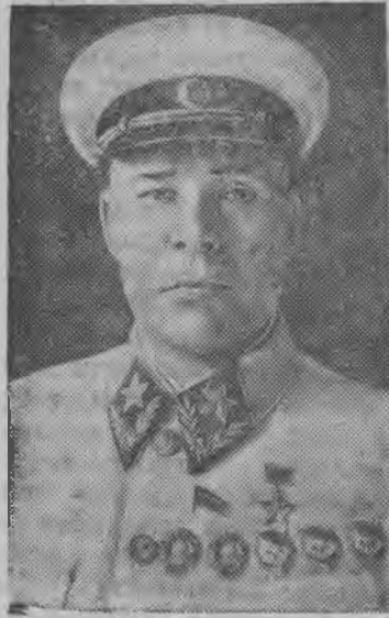
СССР-лэн Оборонаезлэн Народной Комиссарез Советской Союзлэн мар-шалэз Семен Константинович Тимошенко.

„Вуо кезыт'ёс. Йегатскытэе но жожен быдэстоно пудоослы гид'ёс но сион дасяныз. Ужлэсь азиндыкёс решать кароз юн контроль, котькуд районны, нош районны — котькуд колхозын но совхозын пудоез толйы-тны дасяськонез эскорон, колхоз'ёслэн но совхоз'ёслэн уженызы оперативной, конкретной кивалтон, бере кидисёслы юрттон, соосты п о д т я г и в а т ь карон. Сычэ эскерон вамен одйг колхоз но совхоз но пудоез толйытны умоез условнос кылдытэмытэз медаз кылысь. („Правда“ газетлэн 19 октябре передовойсьгытэз).