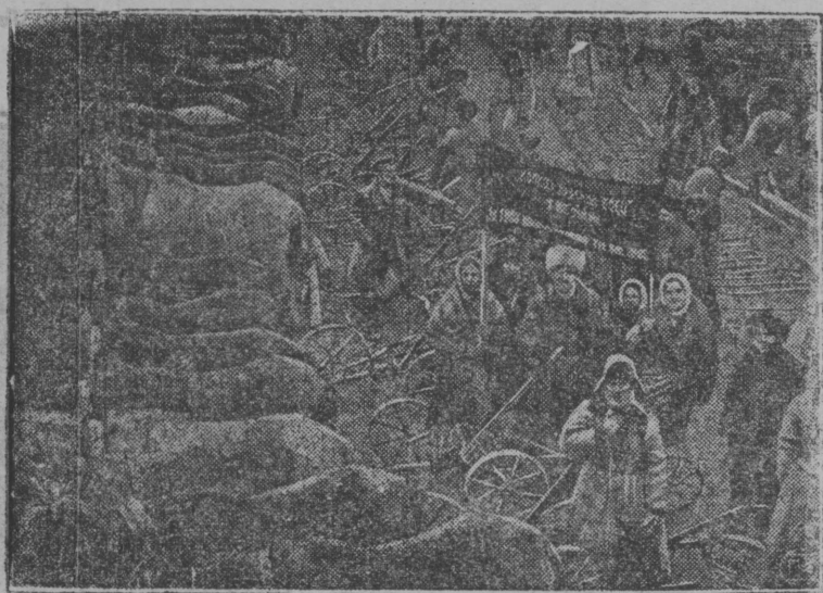
Берлас вылын: Колхозникжас петисны му выль кочны, горны (Тифлис-са станцияын, Крапотынской район, Войвыв Кавказын)