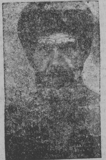
Отса „Мопровец“ колхозыс конух Слав јорт, коді образ- цовөја пуктис вөвјаскөд дөҥөд.