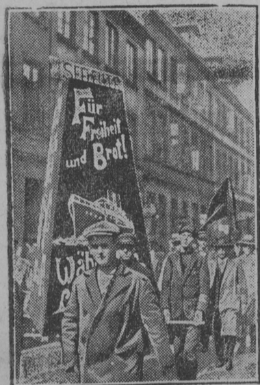
Картина вылын: Гамбургса моракжаслөн демонстрация компартијалөн индөм еписок выло гөлөсујтны призываетөм куҗа.