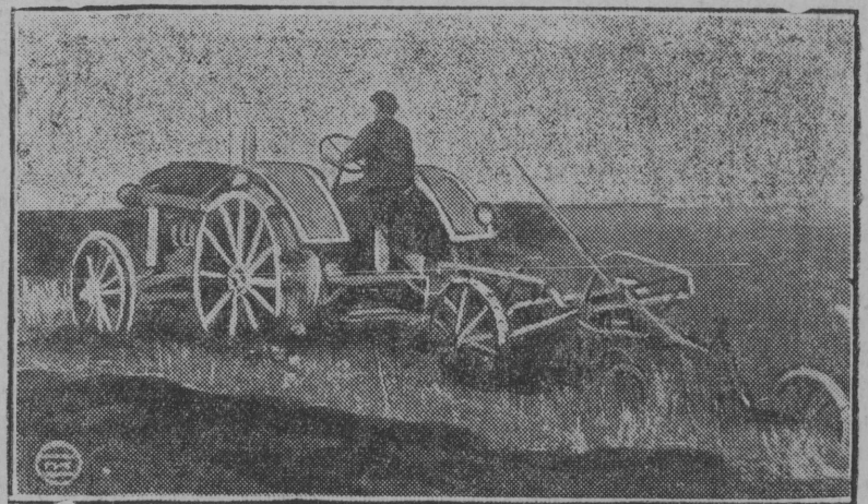
Картина-вылын: Колхозјасын гӧран уж ештӧм бӧрын отсалӧны једӧноличникјаслы коскӧм гӧрны.