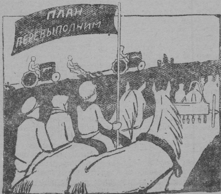
Бура ештөдны урожај чукөртөм да арса гөра көза

Организуйтны крестанаос колхоз-јасө пырөм вылө—мог партијнөј организатсјајаслөн. Пјавілетка пом кежлө дорвыв коллективизатсја колө кызсө ештөдны.