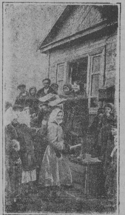
Картина вылын: комсомөлөчјас өөталөны нөгајас колхознөкјаслы

СССР-са колхозцентрын прөдөдөтөтел Јуркөн.