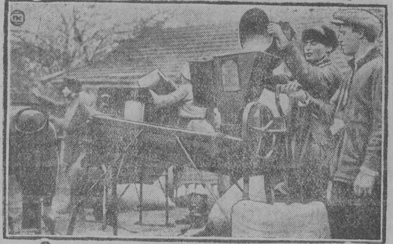
Кубанскөј округын заводитчис көрөм. „Путь Ілјича“ нима колхозлы таво тулыс колө көрөны 10000 гектар му. Став көрөдысыс лоө протравитөма. Картина вылын: протравитөны көрөдыс.