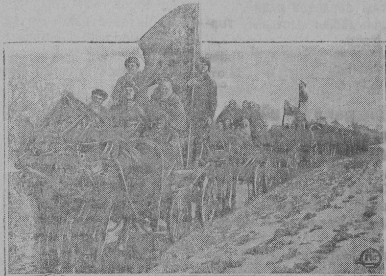
Боголубскөй сельсоветулын (Холперскөй ОКР) өтуйтчавлісны уна колхозјас сөмын ставыс вөлі зөв ічөтө. Бөрја кадө колхозникјас мөтинг вилыны шуисны өтуйтчыны—өтө ыжыд колхозө да сетны „Ворөшілов“ јорт һым. Серпас вилыны: колхозникјас мунөны мөтинг вилө.