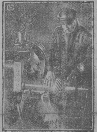
Совхоз „Зайтсево“, Јартсөвскса рајонын (Смоленск окр.) ыстис спөтсіализмјасыг-технөкјасыг бригада матыс колхозјасө.