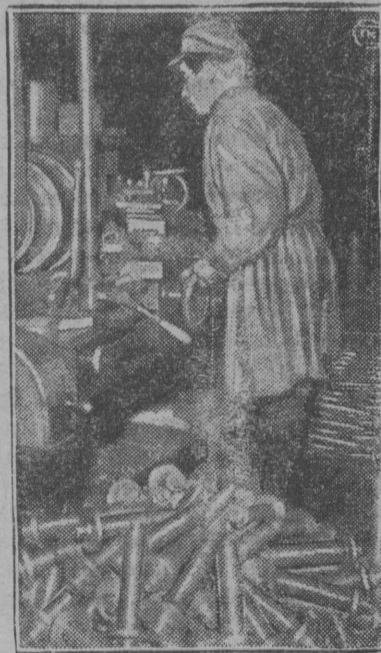
Берпас вылын: коммуна бри-гадаса ударник тракторлы за-паснөј частјас вөчигөн.

Ленинградын, „Краснөј пу-тшопетс“ нима заводын, зев өд-јө вөчөны тракторлы запаснөј частјас. Завод көсјөсө тајө тө-лыснас тыртны заданнөсө 100 прөцент выль. Тракторнөј тсех-шуис агсө ударнөјөн.