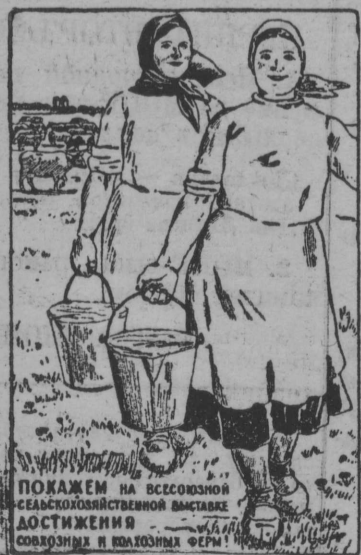
ПОКАЖЕМ НА ВСЕСОЮЗНОЙ СЕЛЬСКОХОЗЯЙСТВЕННОЙ ВЫСТАВКЕ ДОСТИЖЕНИЯ СОВХОЗНИКОВ И КОЛХОЗНИКОВ ФЕРМ!