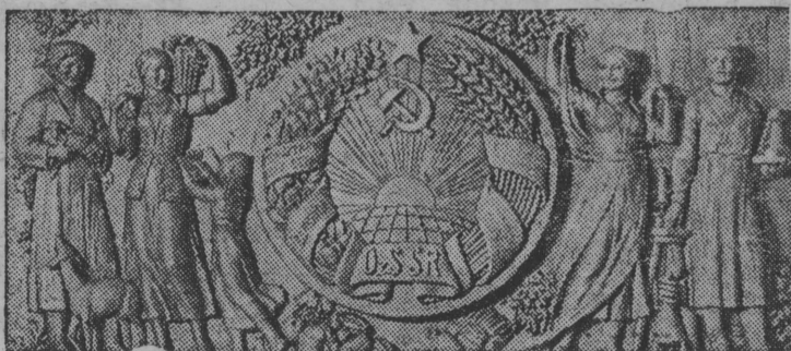
На снимке: Барельеф „Узбекская ССР“ (эскиз).

Павильон СССР на Международной выставке в Нью-Йорке.