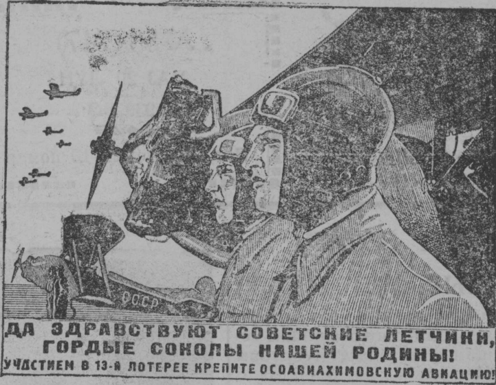
ДА ЗДРАВСТВУЮТ СОВЕТСКИЕ ЛЕТЧИКИ, ГОРДЫЕ СОКОЛЫ НАШЕЙ РОДИНЫ! УЧАСТНИКИ В 13-А ЛОТЕРЕЕ КРЕПИТЕ ОСОБНАХИМОВСКУЮ АВИАЦИЮ!

Со, карікатураыс петкөдлө рајсплавконтораса руководащдөй аппаратлыс кылдчан уждөн „конкретнөй, оператівнөй“ вескөдлөмсө.