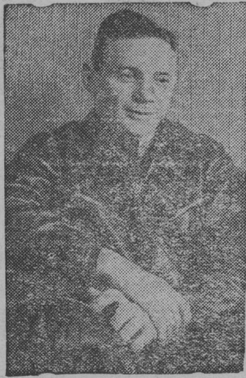
Снімок ылын: Советскöй Сојузса Герој В. К. Коккі-пакі јорт.

ВЦСПС-лөн VIII-öд пленум зев гөгöрвоана індіс профессиональнöй сојузјаслыс могјасöс којмөд сталинскöй пјатілетка олөмө пöртöм куза. „Партіјалөн XVIII-öд сјезд шудмјас,— виставсö ВЦСПС пленум постановленіеын,— сувтöдöны профсојузјас вöчын зев ыжыд могјас ужалыс јöзöс коммунистическöја воспитатöм куза, паскыд массајасöс СССР-са народнöй овмöс развітіјелье којмөд пјатілетнөй план олөмө пöртöм выль мобілізујтöм куза, трудовöй дисциплина јонмөдöм куза, уж производітелност кыпöдöм да социалистическöй ордјысöм паскөдöм куза, рабочöйјаслы материалнöй да культурнöй положеніје вöзö јонмөдöм куза. Тајöс індöсö профсојузнöй организациајас обязанöс пöртны олөмө.