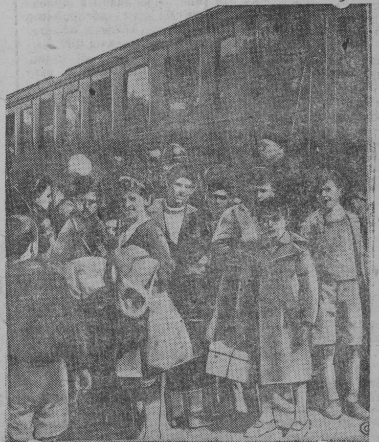
Эвакуированные из Бильбао баскские женщины и дети на вокзале в Ла-Паллис—Рошель (Франция).

Вїа пöс большевістскöј чолöм рајонувса V-öд комсомольскöј конферен- ціја вывса делегатїаслы!