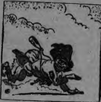
2. „Красной арми кужмо жугиз кулацкой атаман'ёсты“.