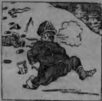
3. „Красной арми кужмо жугиз японской интервент'ёсты“.