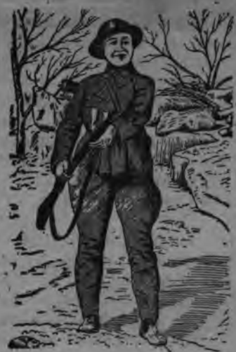
СУРЕД ВЪЛЫН: Китай нылкышно, армие добровольно ностуиги кариз.