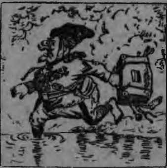
1. „Красной арми кужмо жугиз белой генерал'ёсты“.