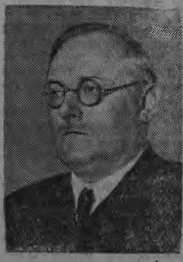
СССР-лэн Верховной Советэзлэн депутатэз, Верховной Советлэн нырысетй сессиеныз СССР-лэн прокурореныз А. Я. Вышинский эшез, назначить каремын.

Вань колхоз'эсын кебит'эс- ты полностью загрузить каро- но но сельскохозяйственной машинаосыз тупат'янэз вакчи дырын быдэстоно. Вань тупат'яса быдэс'тэм машинаос- лэсь качествозэс эскерон пон- на, колхоз'эслэн качественной инспектор'эсыныз эскерыса принять карылоно.