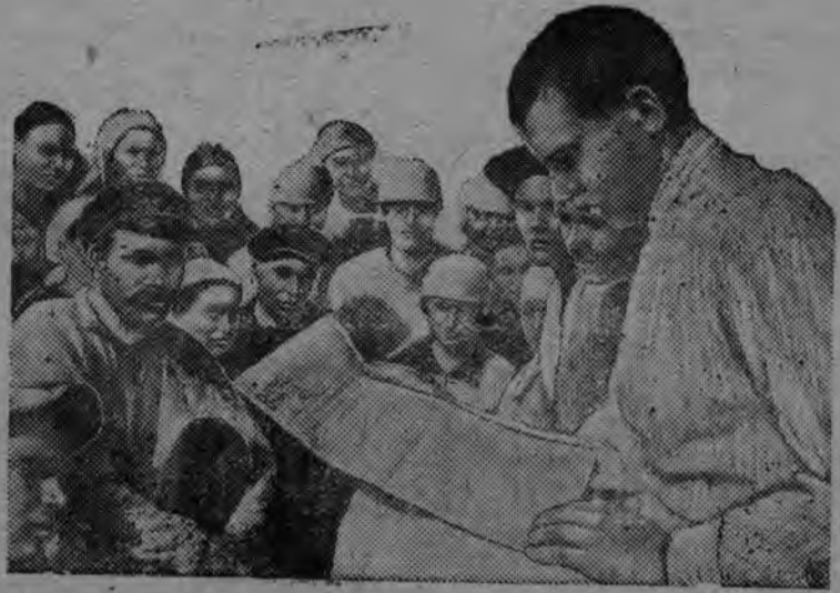
„Красный якорь“ колхозын (Курской область, Стрелецкий район) выль избирательной законэз изучать карон понна кружок организовать каремын.