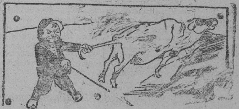
Çarov kutalə lola, a sekkošil Pur̄ysis̄ razalls 2 şurs kubometr saje v̄r.