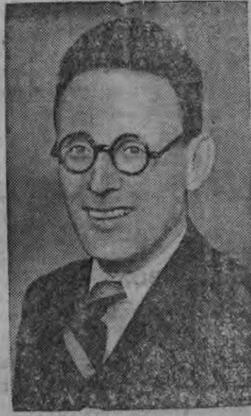
Шахматэн шудон'я СССР-лэн, абсолютной чемпионэз гроссмейстер М. М. Ботвинник.