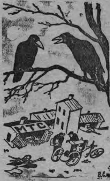
—Асьмеос вазьгес лэся лыктыськеммы,—татын тулыслэн тусыз но уг на адзиськы.

Изба-читальня гуртын социалистической культуралэн очагеныз луэ. Татын вань культурно-массовой но политической уж'эс огазеямын луыны кулэ. Нош асьме районнн изба-читальняос али сыче почетной инты 03 на басьтэлэ. 1940 аре сйзыл Федякино селосысь интеллигенциялэн возиськемез районамы бад'зым отклик шедьтэз. Та пумысен общй собраниястын трос пёртэм резолюциос кутэмын вал. Нош уж резолюциэлэсь кыдэке 03 мыны. Изба-читальняосын али нокыче кружок'эс но уг ужало, беседаос, лекциос отын уг орчтыт'ясько, а кытын-кытын орчтыт'ясько ке но случайысье случает гинэ. Колхозник'эс пблын агро-технической учебаез организовывать карон сярэсь Сарапульской районьсы Шивырьяловской изба-читальнялэсь выль кутскем'эссэ районьсытмы изба-читальняосын подхватить каремын ой вал. Юаське маин гинэ заниматься карыське РОНО-лэн политпросвет уж'эс'я инструкторез Наговицына эш? Та юавлы Бурино МТС-лэн трактор'эсты тупат'ян планэз али но быдэстымтэ. Туннэ нуналлы 10 трактор'эс тупат'ямтэ на.