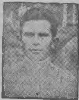
Финударник А. Нуликсв.

Коньдон огазданэз 1-тй февралезь одно ик 75 процентлы вуттоно.