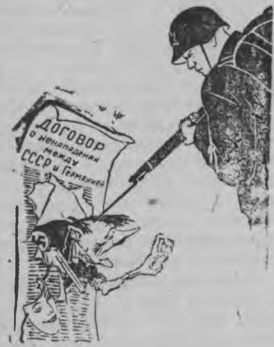
Беспощадно пазьгом но быдтом тушмонэз!

6 июле асьме миноносец'ёслэн отрядзы жугискон'ёс нуиз противниклэн корабль'ёсызлы пумит, куд'ёсыз туртско вал Рижской заливе пырыны. Жугискон дыр'я противниклэн кык миноносец'ёсыз выйтэмын вал, нош, финской заливлэн устьяез минаосын быдтэмын противниклэн подводной лодкаез.