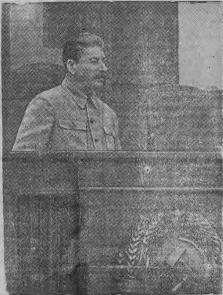
И. В. Сталин эш. (Май 1941 арын)