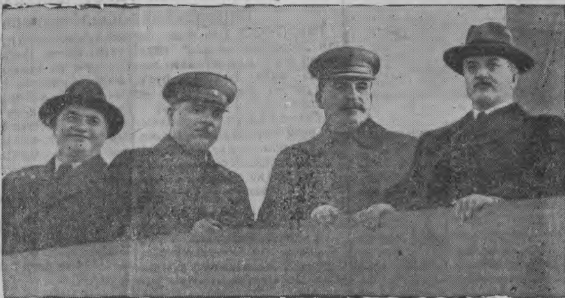
Бурисен паллян пала: В. М. Молотов, И. В. Сталин, К. Е. Ворошилов но Г. М. Димитров мавзолейлэн трибунаяз