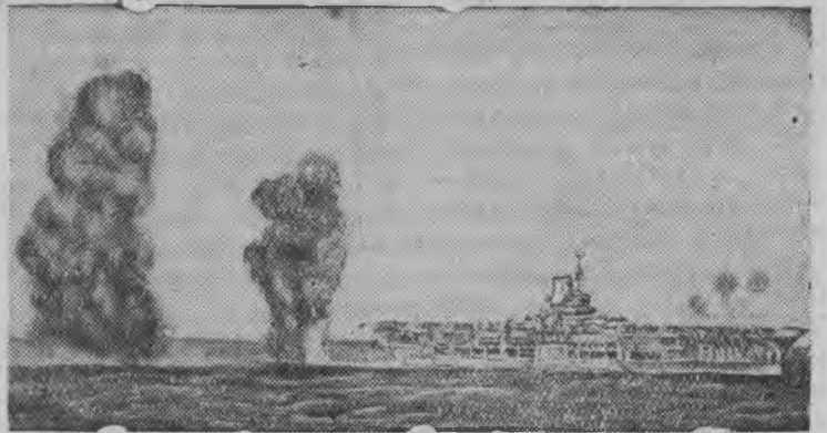
Английской авианосец „Арк райаль“, кудйз бомбардировать каремын немецкой самолет'ёсын, Средиземной морейн

агенство ивортэ, что английской параход „Британия“ 8.800 регистровой брутто-тонн тоннажен выйытэмын германской рейдерен. Параход Англиысь Индие потйз февраль толэзь бырыку. Вань сведениос'я, 18 гражданской но 9 военной пассажир'ёс, озы ик команданэ коняке люкетэз потыны быгатйзы..