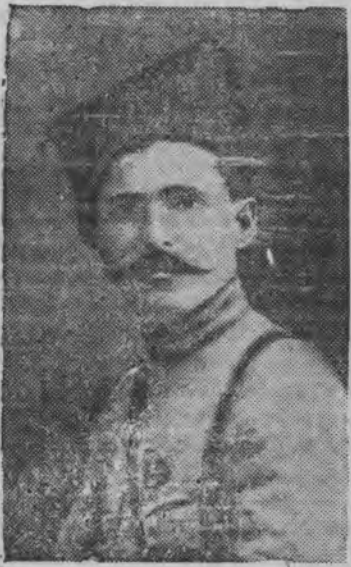
Суред вылын: В. И. Чапаев.

Гражданской войналэн героизлэн, асьме родинамылэн пламенной патриотэзлэн—В. И. Чапаевлэн быремезлы 5 сентябрь 20 ар тырмиз.